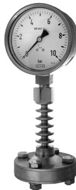
Conjunto de medición con torre de refrigeración

Para la fijación del manómetro se requiere un soporte o un borde dorsal. La diferencia de altura ejerce un efecto al resultado. Por eso se debe considerar este valor en la fabricación y respetar la altura calculada en el montaje (vease el „cuestionario de separadores“). Si esta información no fuera disponible, recomendamos instrumentos con indicador ajustable (sin relleno). Este indicador también es adecuado para la corrección de las desviaciones causadas por variaciones de temperatura.