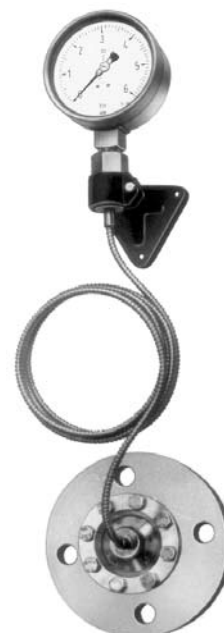
Conjunto de medición con capilar