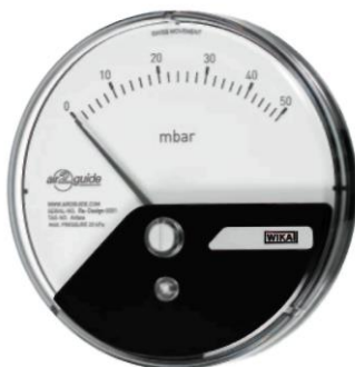
Манометр дифференциального давления Eco модель A2G-05