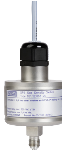
Gasdichteschalter, Typ GDS-MV