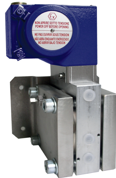
Переключатель дифференциального давления, модель DC

Для обеспечения максимальной гибкости эксплуатации переключатели дифференциального давления оснащены микропереключателями, допускающими непосредственную коммутацию электрических нагрузок до 250 В перем. тока, 10 А.